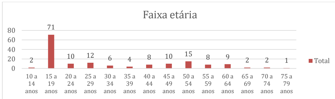
Figura 3: distribuição dos Elos de acordo com a faixa etária.